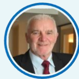
國際少年運動會委員會 Hugh Waters 秘書長