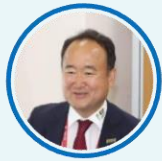
國際少年運動會委員會 Chulwon Shin 副會長