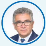
國際少年運動會委員會 Igor Topole 會長